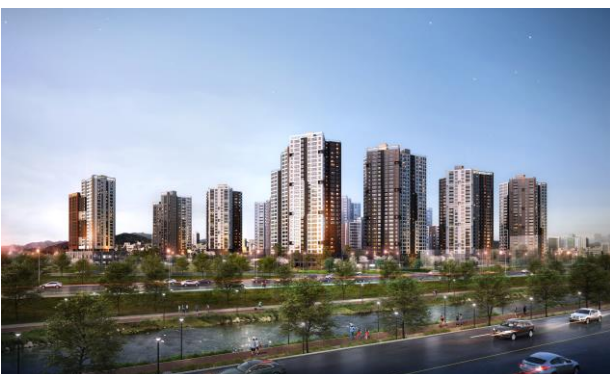
※ 상기 CG 이미지는 소비자의 이해를 돕기 위한 이미지 컷으로 실제와 다를 수 있습니다.

※ 청약 신청 시 내용은 청약자 본인에게 모든 책임이 있으므로, 청약 신청 전 반드시 상세 입주자모집공고의 내용을 숙지하시고 청약하시기 바랍니다.